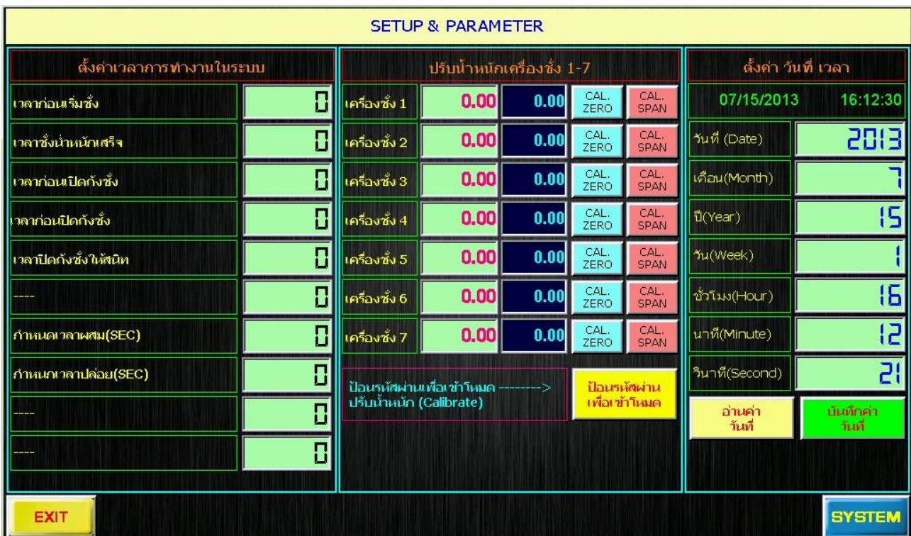
รูปภาพหน้าจอส่วนการตั้งค่าตัวแปรต่างๆของระบบ