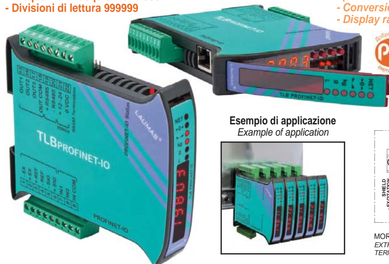
Esempio di applicazione Example of application