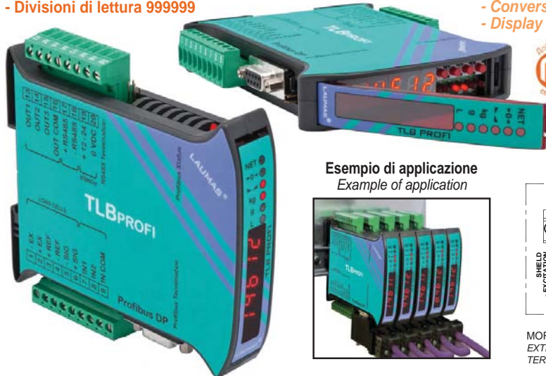
Esempio di applicazione Example of application