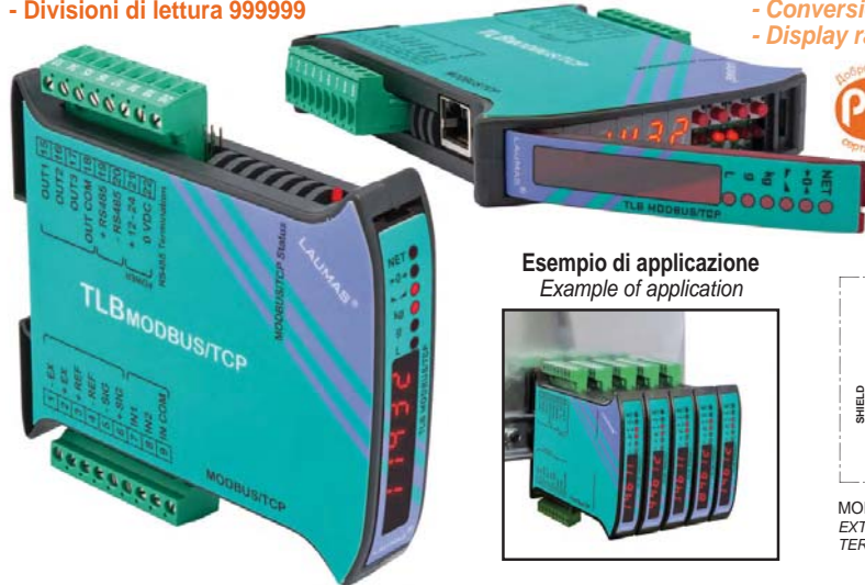
Esempio di applicazione Example of application