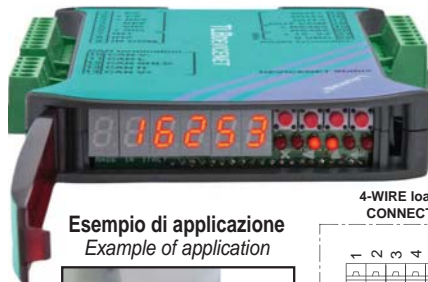
Esempio di applicazione Example of application